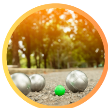
bule i gry terenowe