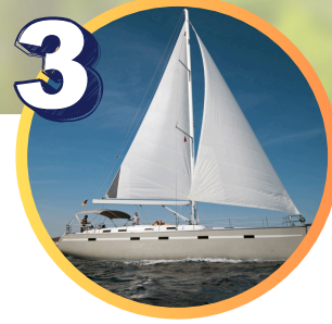
Rejs socjoterapeutyczny pod żaglami

Zobacz, jak było na naszych poprzednich wyjazdach!