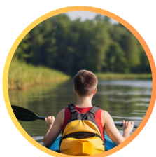
kajaki i rowerki wodne

*w podstawowej ofercie znajdują się 2-3 atrakcji