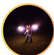
pokazy ogniowe i kuglarstwo