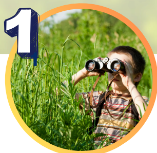
Obóz socjoterapeutyczny z bogatym programem zajęć