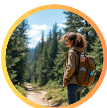
podchody i zajęcia w naturze