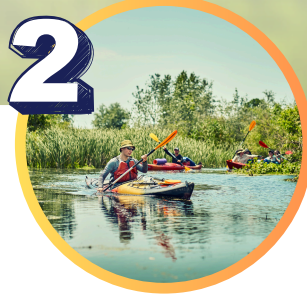
Obóz socjoterapeutyczny ze spływem kajakowym