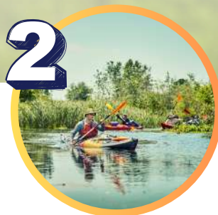
Obóz socjoterapeutyczny ze spływem kajakowym