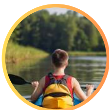
kajaki i rowerki wodne

*w podstawowej ofercie znajdują się 2-3 atrakcji