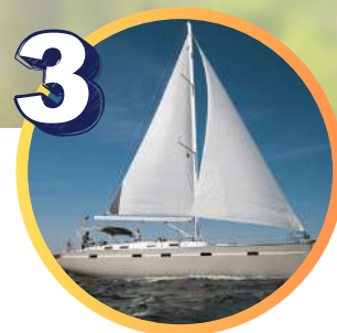
Rejs socjoterapeutyczny pod żaglami

Zobacz, jak było na naszych poprzednich wyjazdach!