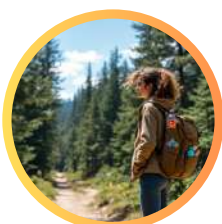
podchody i zajęcia w naturze