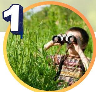
Obóz socjoterapeutyczny z bogatym programem zajęć