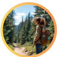
podchody i zajęcia w naturze